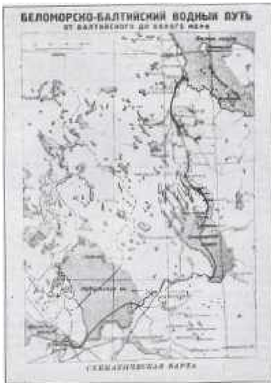
Vandvejene mellem Hvidehavet og Den Finske Bugt. I området mellem 62. og 65. breddegrad blev Hvidehavskanalen bygget med tvangsarbejdskraft.