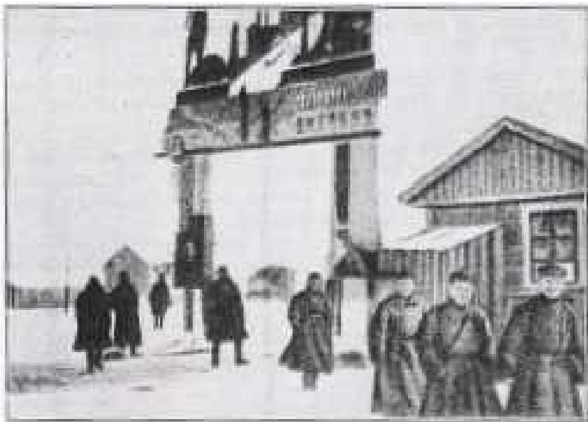
Indgang til lejren ved Volga-Moskva-Kanalen. Lejren er tæt bevogtet af GPU mænd.

Opførelsen af Hvidehavskanalen er kun et enkelt eksempel på tvangslejrene.