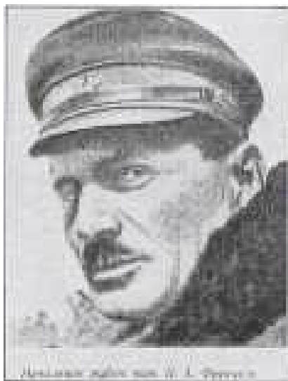
Jøden, Naftaliy Aronsohn Frenkel. Chef for arbejde i lejrene, en højtstående GPU- tjenestemand.

"Kære ven: Vi er i nød og tvunget til at bede dig om din hjælp og støtte. Da vi blev bragt hertil, måtte vi ikke medbringe noget, ikke engang vores sidste ko. Vi er i en skov i en lejr. Vi er baptister, en gruppe af syv - jeg er invalid og kan ikke arbejde. Svar venligst om vi kan hjælpes, for vi er fordømt uden hjælp. Med hilsener og en inderlig begæring...."