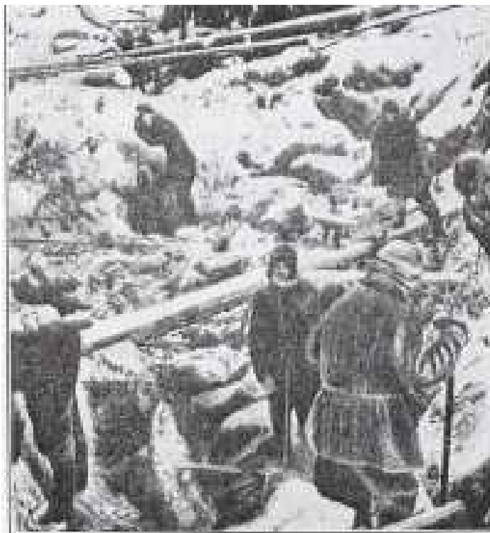
(36) S. W. C., side 96.

Men disse etablerede "standarder" overholdtes ikke altid - som alt andet var de med forbehold for ændringer..