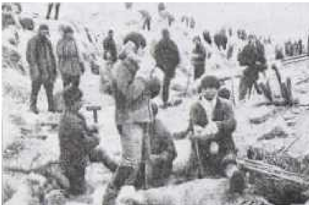
Eksilerede under opførelsen af Hvidehavskanalen. Hober af lig har bogstaveligt talt dækket denne jordstrækning, før kanalen var færdig.

"Omkring midten af april 1935, blev to tog lastet med fanger fra Elizavetina-banegården (mellem Narva og Gatchina) afsendt. Begge tog blev overlastet, og nødløkomotiver måtte indsættes. Fangerne var hovedsageligt finske landmænd med et par få estere blandt dem. Det siges, at næsten alle estiske bønder fra det vestlige Ingermannland overføres til Centralasien."