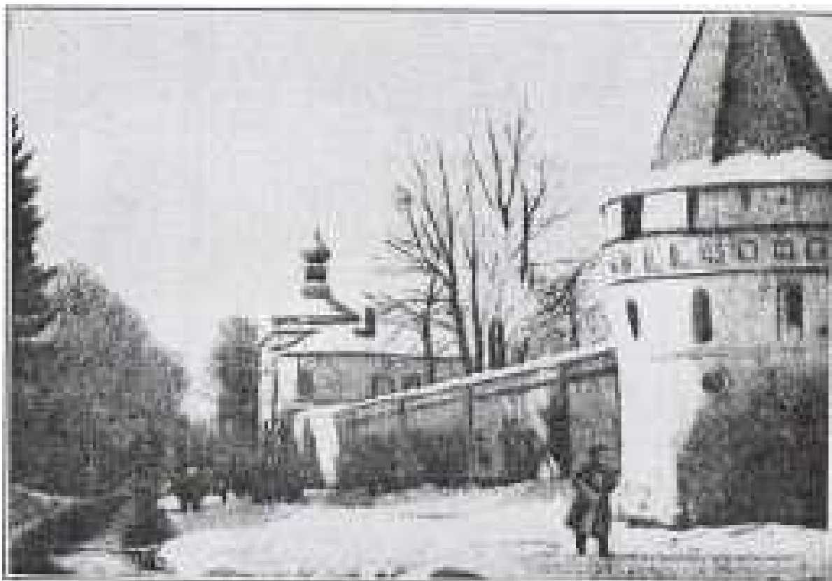
Volga-Moskva-Kanalen. GPU's jødiske administration er indkvarteret bag denne fæstnings væg.

GPU's jødiske bødler kræver flere ofre. Reserver skal bringes til stedet. Og således høres Moskvas utålmodige og rasende stemme: