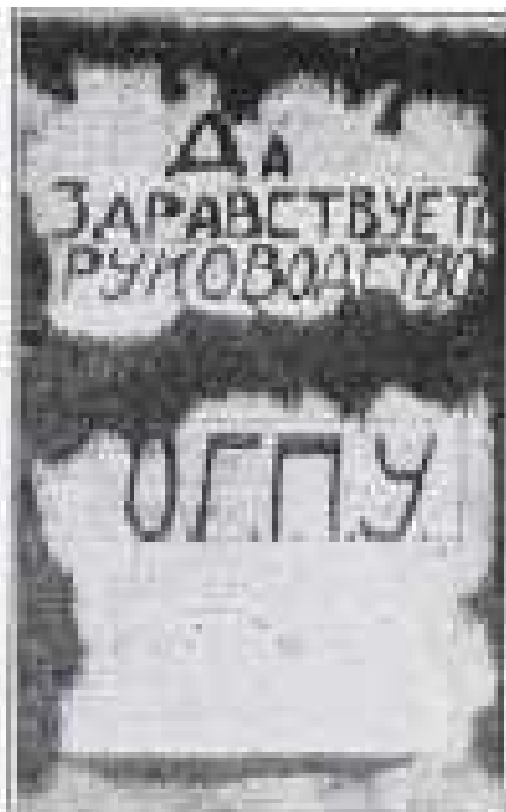
Indskridt på en væg i barakken: "GPU's administration længe leve."

GPU-administrationen af virksomhed var sammensat af 37 medlemmer. De vigtigste, herunder Jagoda, var: