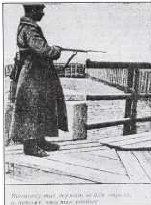
De eksilerede er altid tæt bevogtet. Dette fotografi viser en vagt i arbejde - parat til aktion. Den russiske titel under billedet lyder lidt humoristisk: "Våbnet holdes ikke på denne måde for at skræmme, men af praktiske årsager."

Selvom de stadig betragtes som fanger og ikke må forlade lejrene, har de some vogtere ret til at bevæge sig frit rundt. De anbringes i separate lejre i så vidt et omfang som muligt og er for det meste klædt i militæruniformer. Deres madrationer er større, indeholder tobak og svarer i bund og grund til en Rød militærmands. (21)