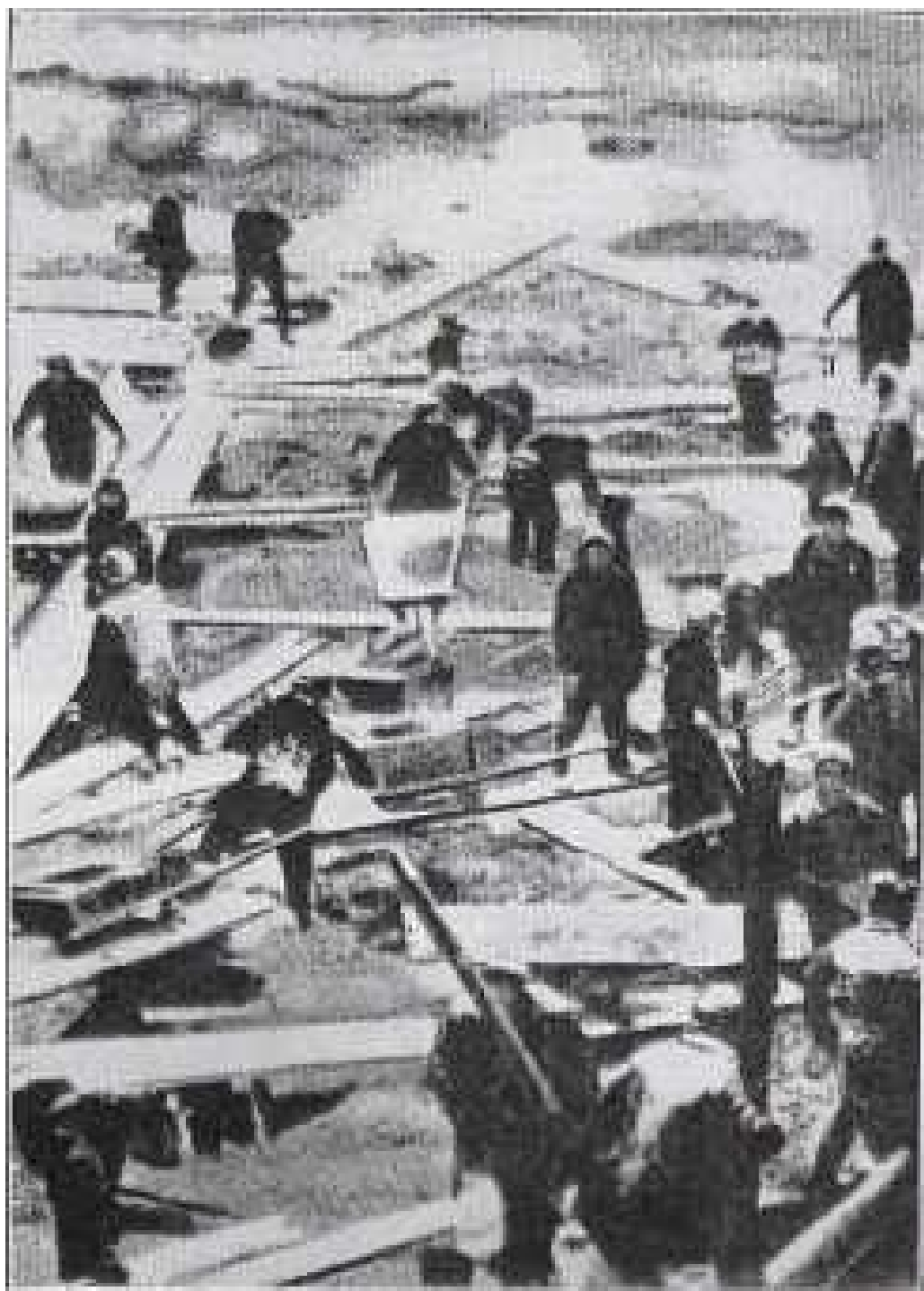
De eksilerede arbejder midt i et ståhej af planker. Den enorme mængde jord og sten skal transporteres med blot trillebører. De arbejder ofte i 48 timer, uden afbrydelse, indtil de kollapser.