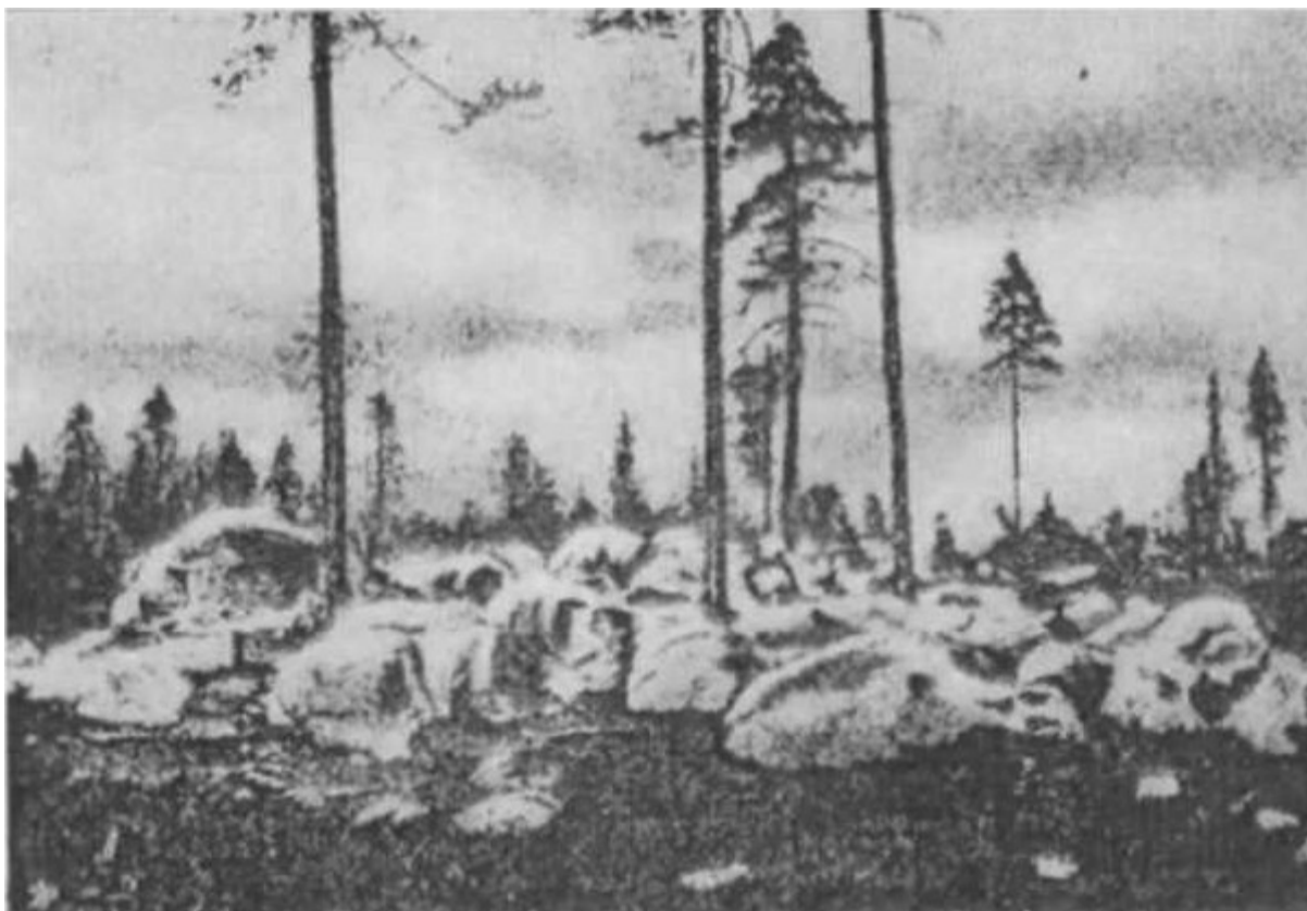
Et landskab i Sibirien. Jorden er dækket med store sten og kampesten. Hvidehavskanalen blev bygget gennem dette ensomme og stenede land, udelukkende af tvangsarbejdskraft, hvilket betyder, at den blev bygget med menneskeblod.