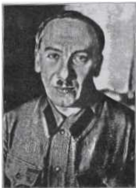
Jøden Jagoda (Hershel Jehuda), chef for Tjekaen - GPU, nu kaldet "Indenrigskommissariatet". Alle koncentrationslejre er under hans tilsyn.

En andel af intelligentsiaen var faldet under verdenskrigen, og et endnu større antal faldt under borgerkrigen, der førte op til indsættelsen af jødisk kontrol. Resten enten flygtede ud af landet eller blev brutalt massakreret af Tjekaen. Kun et meget lille antal fik lov at bidrage med deres viden og erfaring i tjeneste for den nye stat.